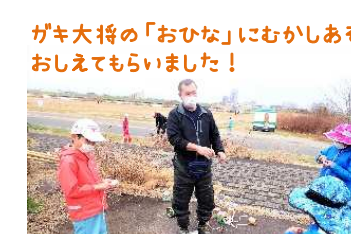
ガキ大将の「おひな」にむかしあそびもおしえてもらいました！

たまねぎの皮でハンカチを染め、サザンカの花びらで和紙を染めました。 どんぐりと粘土を使ったクラフトや枝を使った「木ホルダー」もできました！ たまねぎの皮で染めてみました