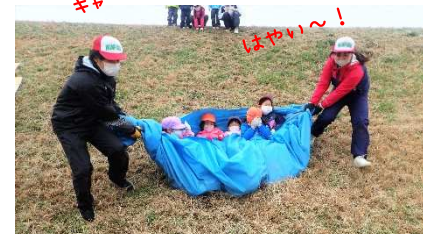
大人気！ グレーシートすべり！

毎年恒例、土手すべり、たこあげ。小学生は、「むかしあそび」も楽しみました。寒くても体を動かして遊べば、からだもぼかぼか