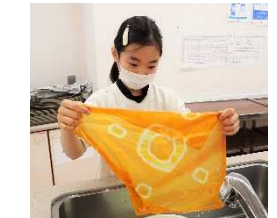
個性的な作品ができました